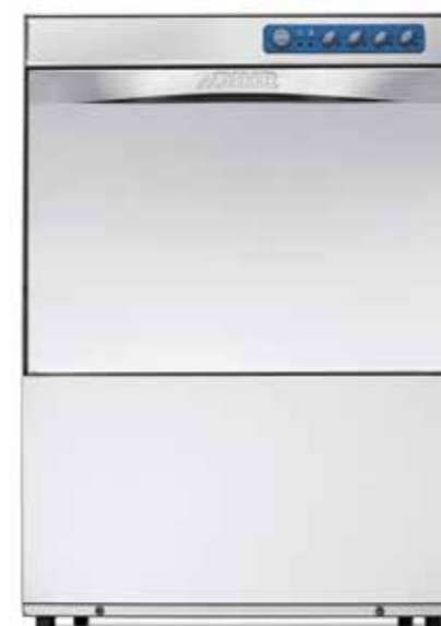
GS 50 ECO - GS 50