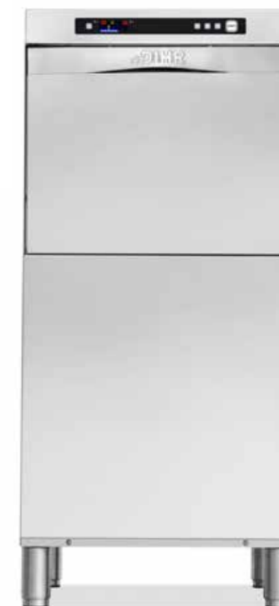
GS 85 T